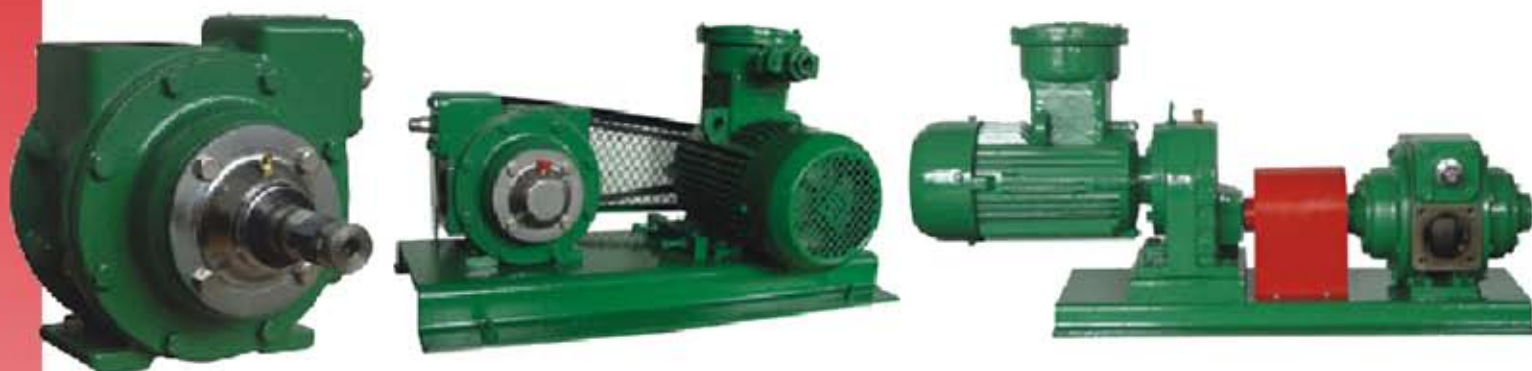
Dispositivo con cinghia a V

SERIE NK-YB dimensioni porta disponibili 2", 2.5" e 3"